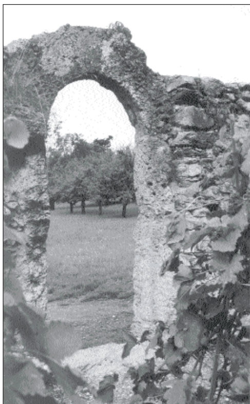
Association du château de la Roche - Ollon