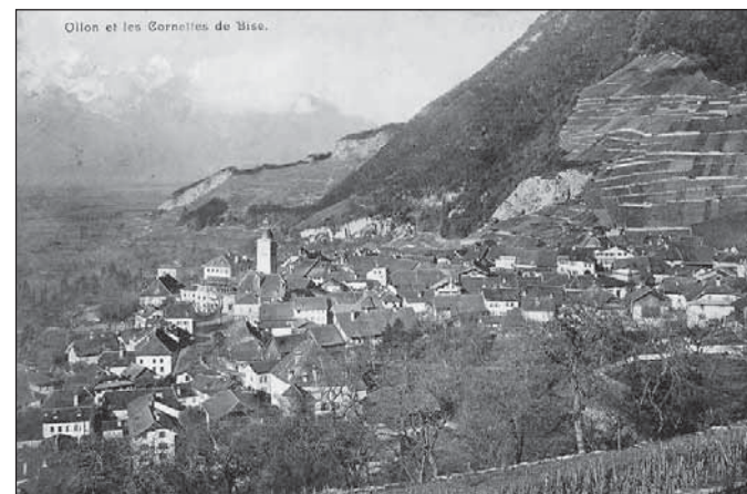
Ollon - 1915