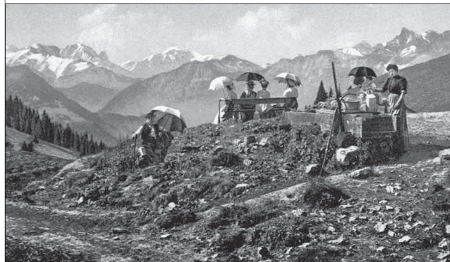
Excursion à Bretaye - 1909