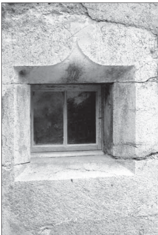
Association du Château de la Roche - Ollon