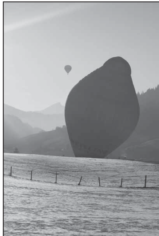
Festival international des Ballons de Château-d'Oex, 2011

L'Unesco propose de regrouper ces traditions en cinq catégories : les expressions orales (légendes, proverbes, etc.), les arts du spectacle (musique, danse...), les pratiques sociales, rituels et événements festifs (fêtes