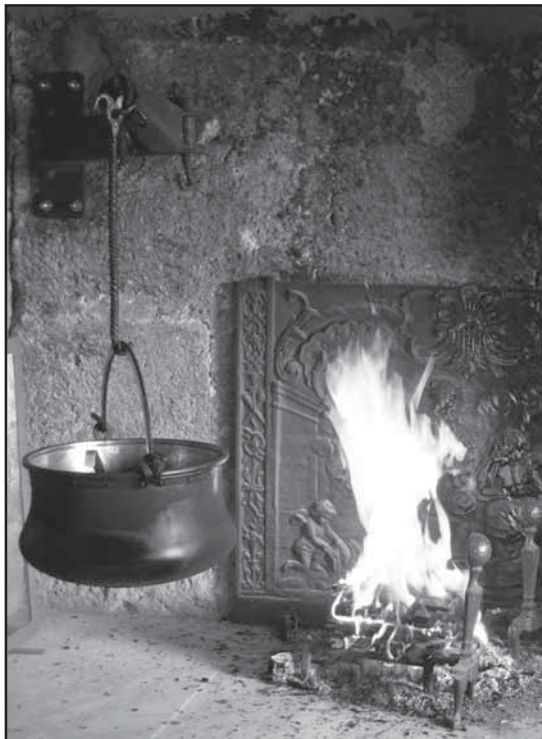
Association du Château de la Roche - Ollon